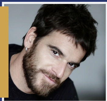
ALFONSO BASSAVE Actor